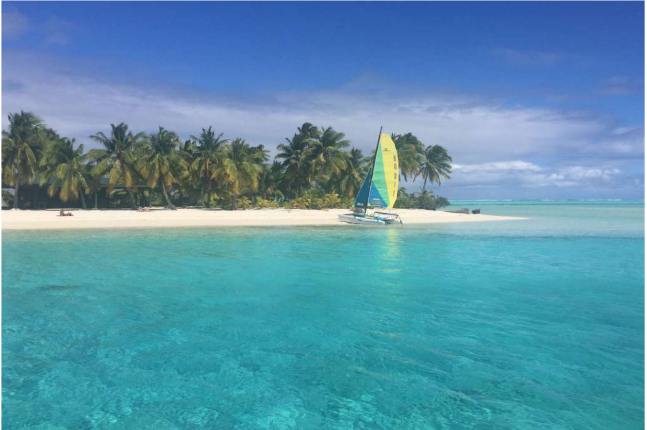
《 クック諸島 アイツタキ島付近 》