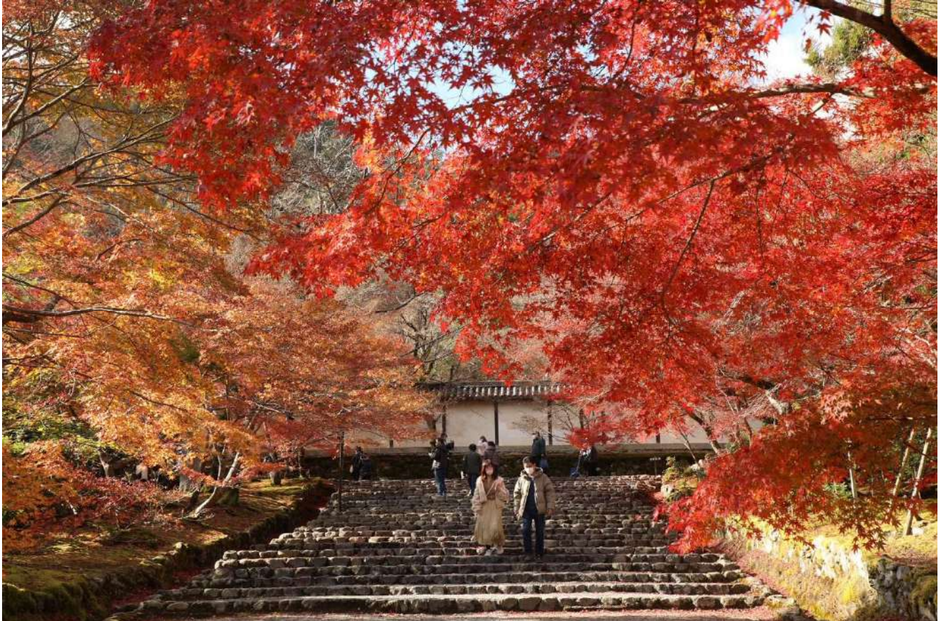
《紅葉の馬場（京都 二尊院）》