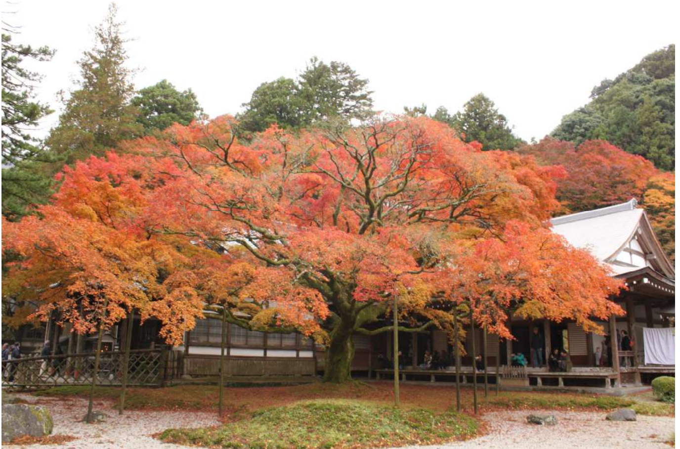
《雷山千如寺の紅葉》