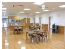
食堂兼多目的ホール

認知症の方が入居され、食事の支度や掃除、洗濯などをスタッフと共同で行い、家庭的で落ち着いた雰囲気の中で生活を送る小規模な施設です。少人数の中で「なじみの関係」をつくることによって心身の状態を穏やかに保ち、役割を持ってイキイキとした生活を送れるようスタッフがサポートいたします。