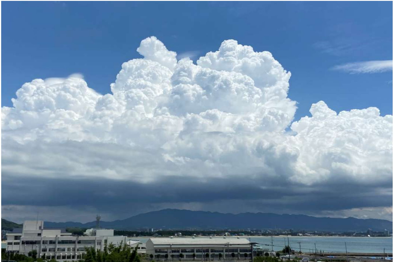
《夏だ！入道雲だ！（福津市）》